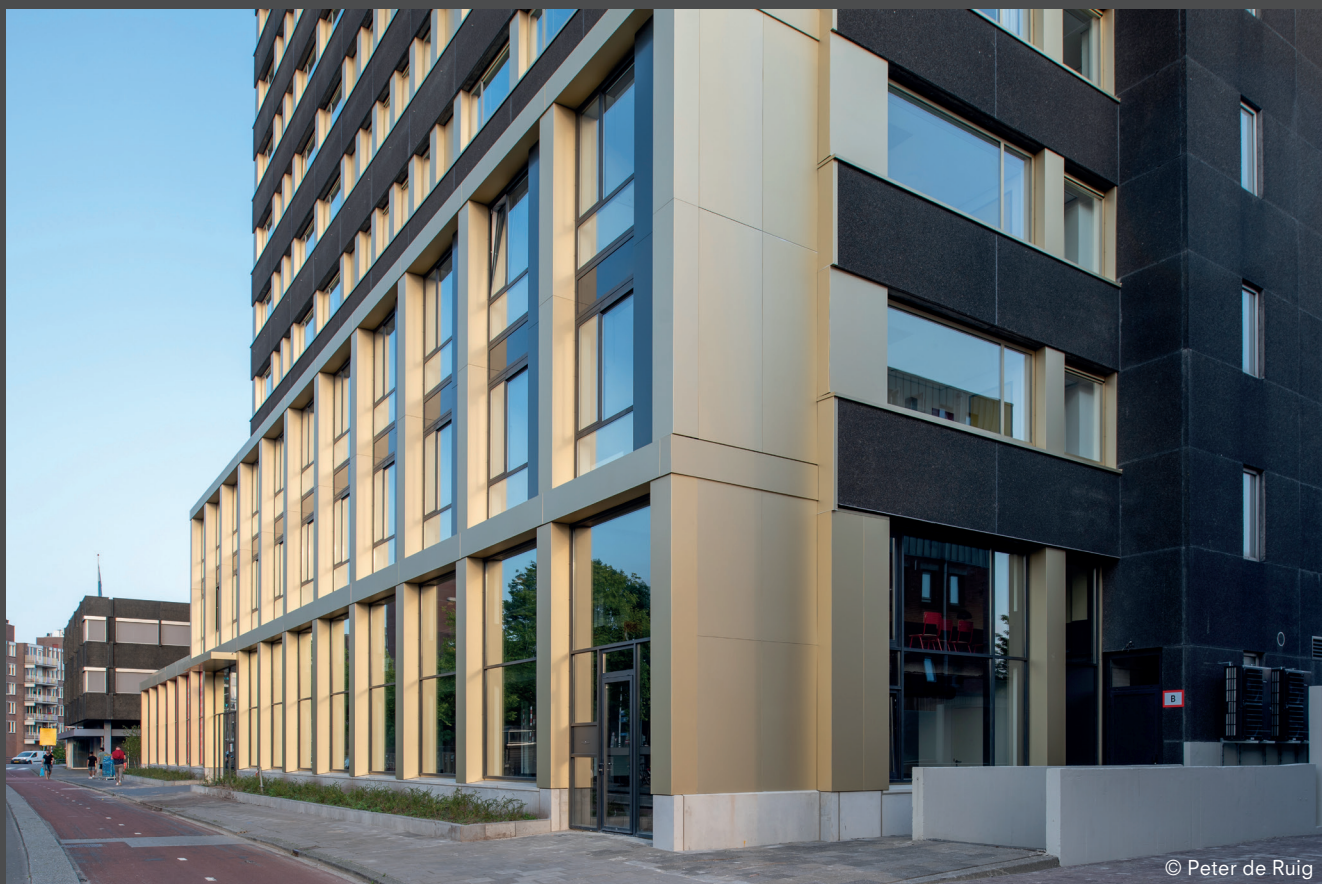
Black Box, Groningen | Team 4 Architects | Les éléments de façade en premium anodised mat rayonnent d'une élégance suprême. Black Box, Groningen | Team 4 Architects | Gli elementi della facciata in premium anodised opaco trasmettono un'eleganza raffinata.

L'ossidazione elettrolitica dell'alluminio arricchisce il materiale con uno strato di ossido protettivo al quale, in un secondo momento, viene applicato il colore. Grazie a questo processo, i colori conservano il proprio vigore e sono protetti dalla corrosione. Per facciate di alta qualità con un effetto duraturo nel tempo.